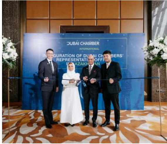
افتتاح مكتب غرفة دبي العالمية في كازاخستان

اختتمت غرفة دبي العالمية فعاليات بعثة "آفاق جديدة للتوسع الخارجي" في المغرب بتنظيم منتدى أعمال في مدينة الدار البيضاء