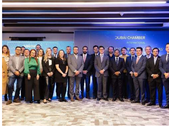
افتتاح مكتب غرفة دبي العالمية في كولومبيا

وفي إطار هذه البعثات التجارية، نظمت غرفة دبي العالمية خلال العام 2024 نحو 2,227 لقاءً ثنائياً للأعمال بين شركات دبي المشاركة في البعثات مع نظرائها في الأسواق الثمانية التي تمت زيارتها، بنمو وقدره 88% مقارنة بالاجتماعات التي تم تنظيمها في 2023. وواصلت مبادرة "آفاق جديدة للتوسع الخارجي" دورها الحيوي في دعم التوسع الدولي للشركات العاملة في دبي، والمساهمة بفعالية في تنمية التجارة الخارجية لإمارة دبي.