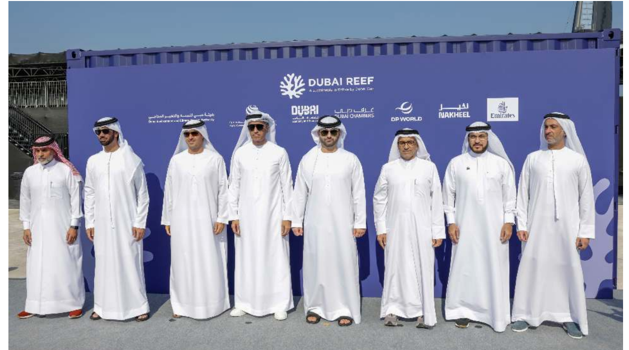
شهد سموّ الشيخ منصور بن محمد بن راشد آل مكتوم، رئيس مجلس دبي الرياضي، إطلاق المرحلة الأولى من مشروع "مشدّ دبي"

خلال العام 2024، عزز مركز أخلاقيات الأعمال التابع لغرفة تجارة دبي جهوده الرامية لتعزيز المسؤولية الاجتماعية للشركات ودعم ممارسات الأعمال المسؤولة.