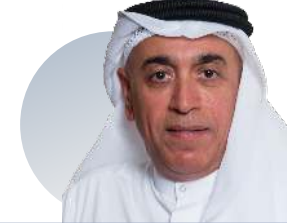
سعادة أحمد عبدالله بن بيات نائب رئيس مجلس الإدارة